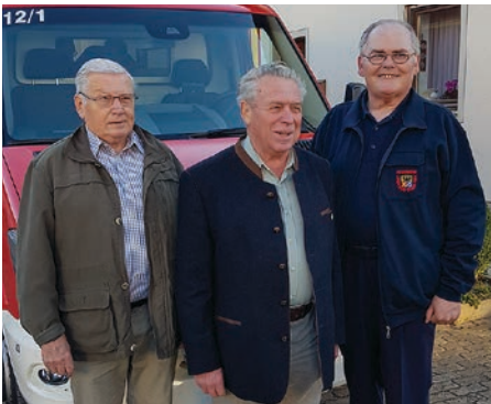
Die „Gründerväter“ des Inspektionstreffens.