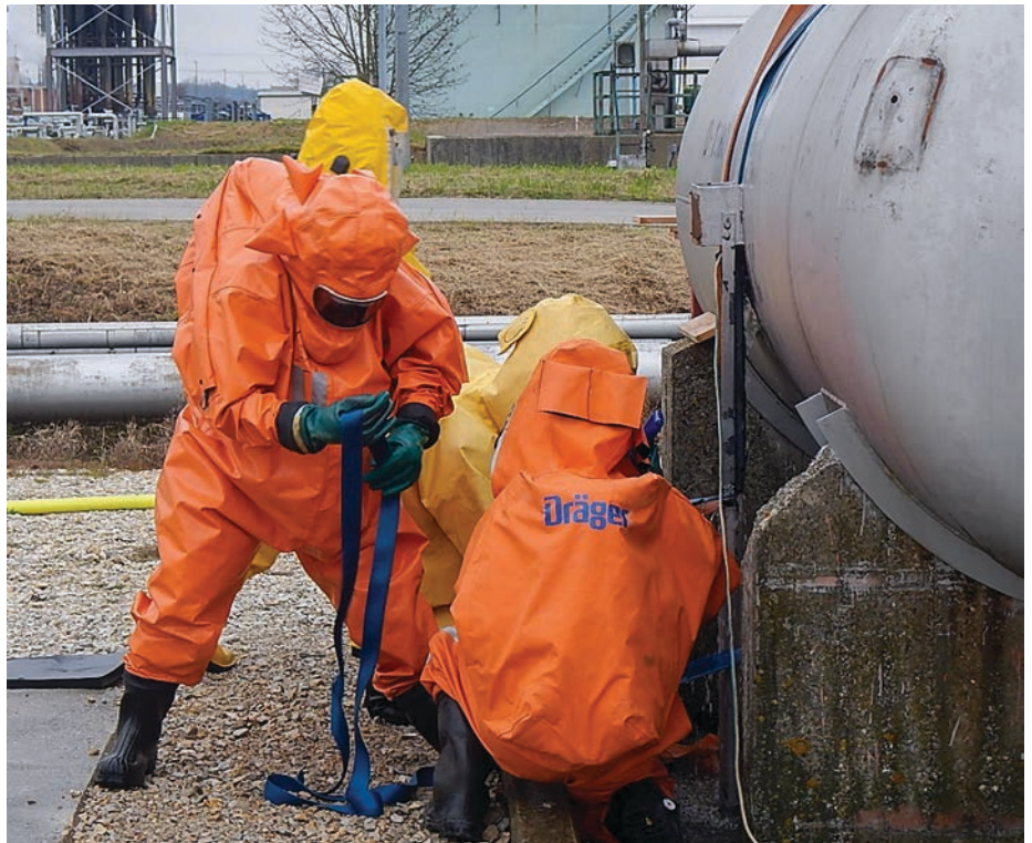
Übung auf dem Werkgelände: Abdichten eines leckgeschlagenen Gefahrgutbehälters unter Einsatz von Chemikalienschutzanzügen.