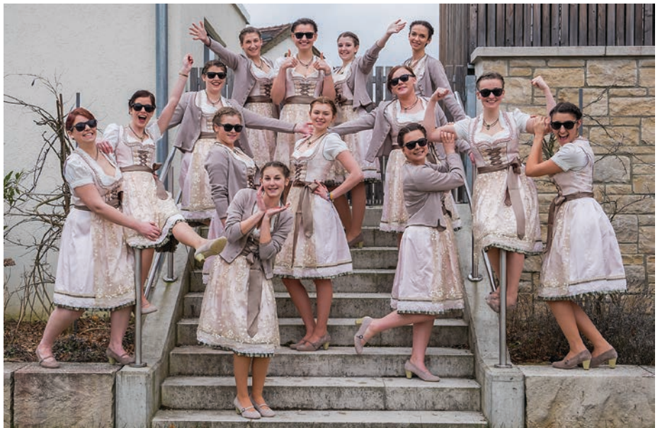
Festdamen der Feuerwehr Böhmfeld.