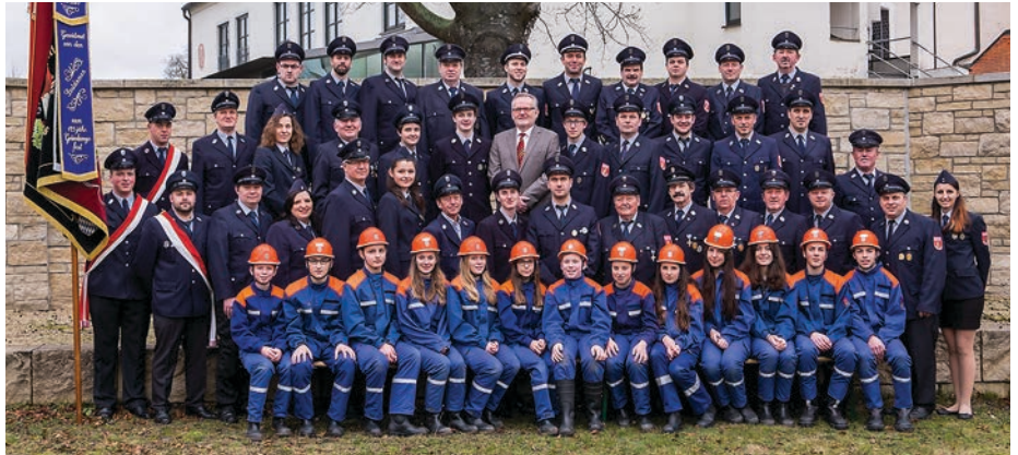
Mannschaft der Feuerwehr Böhmfeld.

Bereits 1035 hatte die Benediktinerinnenabtei St. Walburg in Eichstätt Besitzungen in Böhmfeld, 1479 kaufte das Kloster das Schlossgut Böhmfeld dazu und blieb bis zur Säkularisation (1803) größter Grundbesitzer des Ortes. An diesen maßgeblichen Einfluss erinnert im Gemeindewappen der Äbtissinnenstab und die Farbgebung Rot-Gold in Anlehnung an die Wappenfarben der Abtei. Auf geographische Besonderheiten des Gemeindegebiets, den Reisberg und die von dort ausgehende Wasserversorgung, weisen im Wappen der Dreiberg und die Wellenspitze hin. Gleichzeitig erinnert dieses Quellensymbol und die aus dem 17. Jahrhundert stammende Bonifatiusssäule im hinteren Feld an die Gründung Böhmfelds, die mit dem Böhmfelder Kirchenpatron St. Bonifatius und einer Quelle in Verbindung gebracht wird.