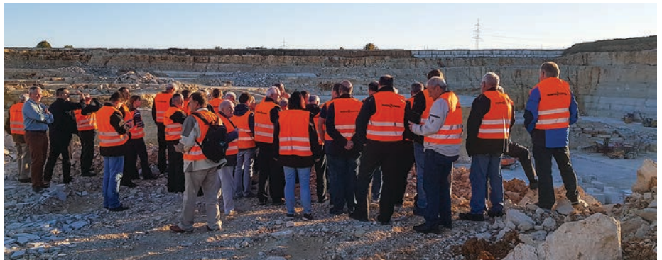
Besichtigung der Firma Franken-Schotter.