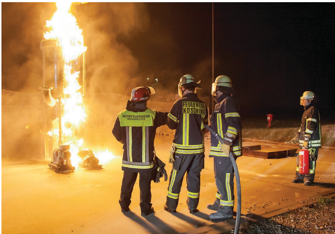
Training für die Feuerwehr Kösching an einem dreidimensionalen Feuer auf dem Übungsplatz der Gunvor Raffinerie.

Viele seiner neuen Kollegen, so erzählt er, kommen von anderen Werkfeuerwehren, Berufsfeuerwehren oder aus dem Rettungsdienst. Bei Gunvor würden sie gemäß den Bedürfnissen der Raffinerie weiter fortgebildet. „Wir sind hier Spezialisten mit Allround-Fähigkeiten“, sagt er schmunzelnd und verweist darauf, dass viele Mitglieder der Werkfeuerwehr auch im Privatleben Mitglieder einer Freiwilligen