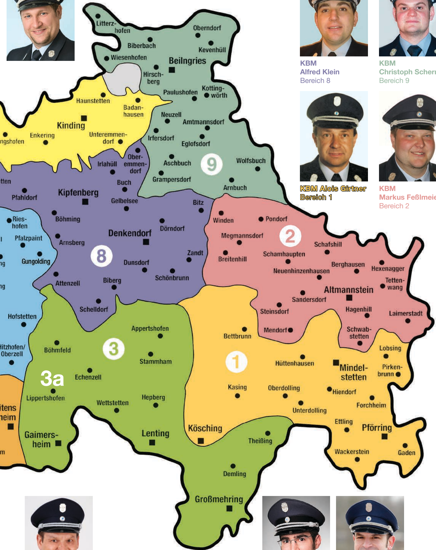
KBM Markus Feßlmeier Bereich 2