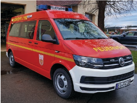
Mannschaftstransportwagen (MTW) der Feuerwehr Wellheim-Konstein