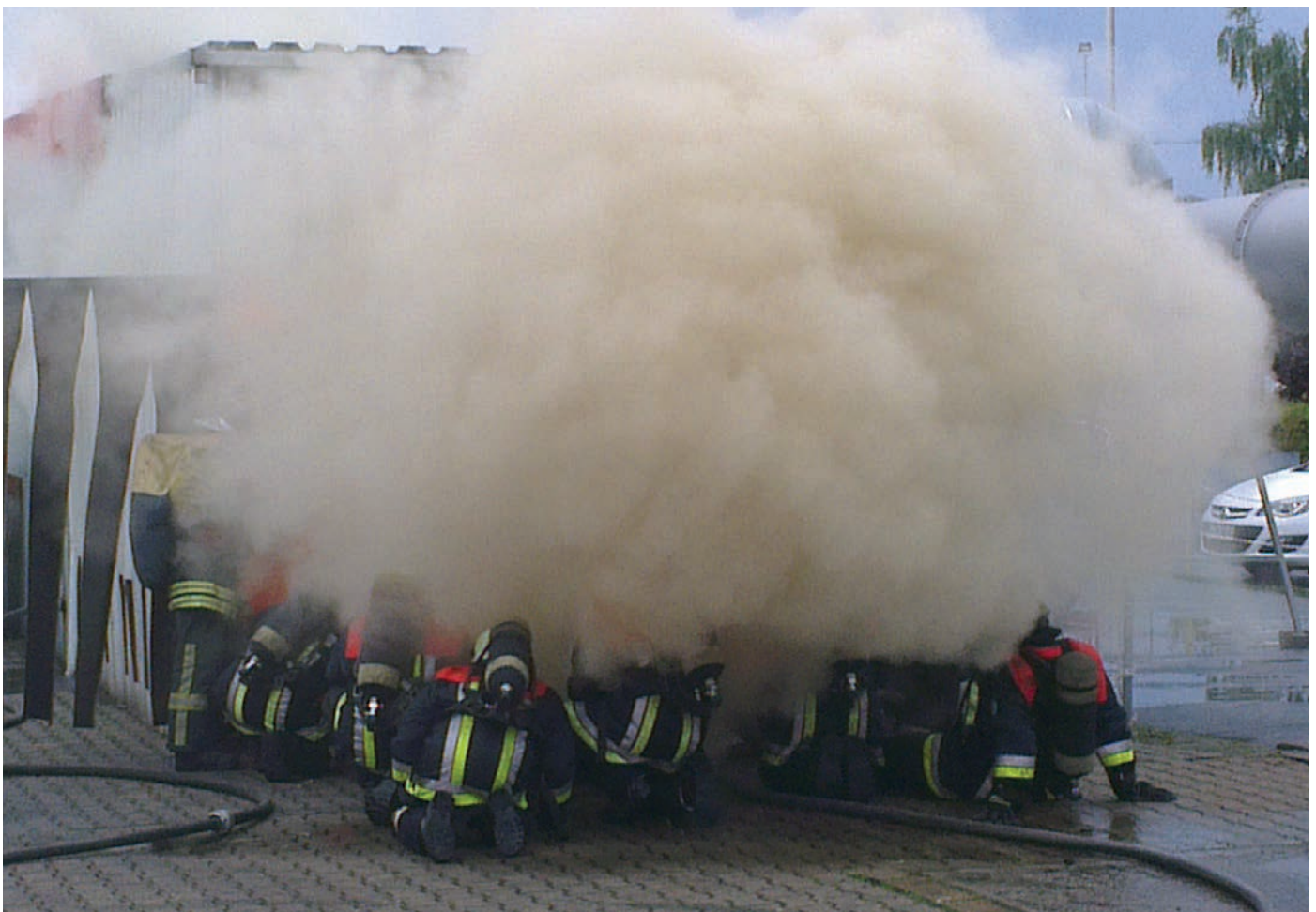
Ausbildung der Werkfeuerwehr an einem Flashover-Container mit Rauchdurchzündung (Ausbildungszentrum DMT Dortmund).